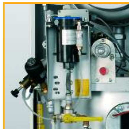
Die optionale Sprüheinheit mit Freispüleleitung zum Ausrüsten direkt aus dem Gebinde