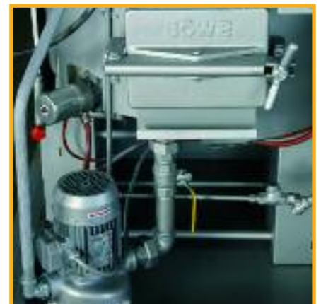
Die automatische emissionsfreie Destillationsentsorgung erfordert im Normalbetrieb keine manuellen Arbeiten

Dank der durchdachten Kombination aus Nadelfänger und Flusenfilter an einer zentralen Stelle, wird die tägliche Wartung an Ihrer BÖWE Maschine auf ein Minimum reduziert. Die große Filterfläche und der großzügig konzipierte Nadelfängerkorb erlauben im Standardbetrieb eine nur einmalige Reinigung pro Tag. Ein weiteres, zudem umweltfreundliches Merkmal der StarLine ist die serienmäßige emissionsfreie Destillationsentsorgung. Die Ausnutzung eines azeotropen Gemisches aus Wasser und Per auf Basis der Siedepunkt-Herabsetzung erspart hier wartungsanfällige, mechanische Konstruktionen.