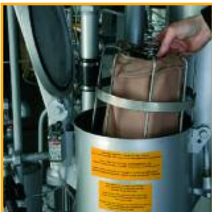
Bewährtes Prinzip: Auch an PX Modellen nur eine Öffnung für Nadelfänger und Flusenfilter

mung der Ware mit Trocknungsluft ermöglicht und eine effektive, schnelle Trocknung selbst bei anspruchsvoller Ware bewirkt. Die von BÖWE entwickelte Trommellochung wird seit Jahren in der PremiumLine eingesetzt. Zusammen mit optimierten Programmabläufen und deutlich reduzierten Chargenzeiten bietet die BÖWE StarLine starke Leistung zum günstigen Preis.