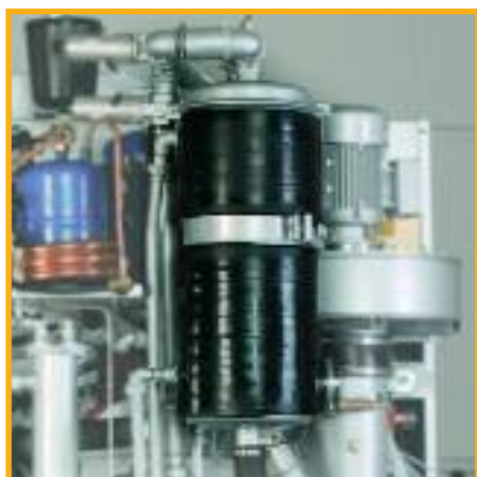
Die SLIMSORBA zur Einhaltung strengster Umweltauflagen und für beste Arbeitsbedingungen

Für höchste Qualitätsansprüche bietet BÖWE auch bei den StarLine Maschinen standardmäßig eine Dosiereinheit. Optional erhalten Sie eine weitere Dosiereinheit und eine Sprüheinheit zum Ausrüsten von hochwertiger Garderobe.